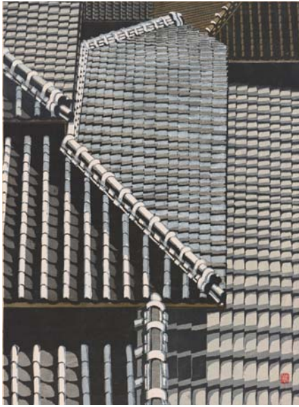
関野準一郎「瓦屋根」1957年

Woodblock print; ink and color on paper On loan from the Ken and Kiyo Hitch Collection, LTS2017.3.26