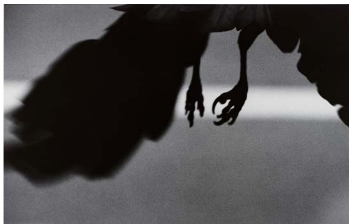
深瀬昌久「公園通り」(『鴉』シリーズ) 1982年

Gelatin silver print, Purchase and partial gift from Gloria Katz and Willard Huyck and purchased through the Freer|Sackler acquisitions fund in honor of Julian Raby, director emeritus of the Freer Gallery of Art and the Arthur M. Sackler Gallery, S2018.2.24