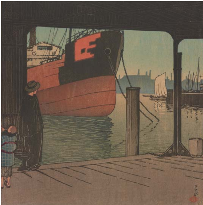
川瀬巴水「月島の渡船場」(東京二十景) 1921年

Woodblock print; ink and color on paper On loan from the Ken and Kiyo Hitch Collection, LTS2017.3.14