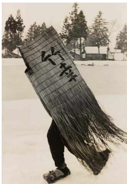
濱谷浩「ミノをまとった男性」(新潟県) 1956年

Gelatin silver print, Purchase and partial gift from Gloria Katz and Willard Huyck and purchased through the Freer|Sackler acquisitions fund in honor of Julian Raby, director emeritus of the Freer Gallery of Art and the Arthur M. Sackler Gallery, S2018.2.27