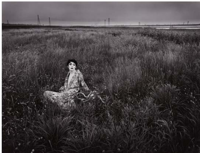
細江英公「シモン 私風景 荒川放水路河川敷、 四ツ木付近（作品1）」1971年