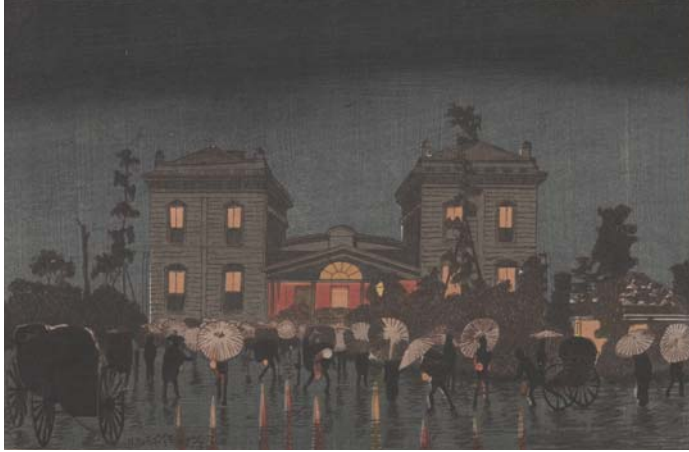
小林清親「新橋駅」1881年

Woodblock print; ink and color on paper Robert O. Muller Collection, S2003.8.1198